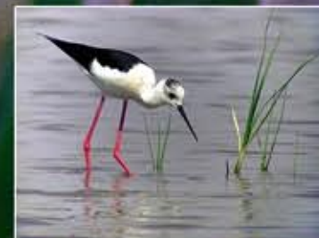
Cames llargues Cigüeñuela común Himantopus himantopus