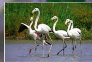
Flamencs Flamencos Phoenicopterus ruber

Las lagunas del Delta están rodeadas de arrozales, y son lagunas litorales conectadas directamente con el mar, circunstancias éstas, que determinan su papel de frontera entre el medio marino y el medio acuático continental. Durante el ciclo productivo del arroz, reciben grandes aportaciones de agua dulce de los arrozales, lo cual provoca grandes oscilaciones en el nivel de salinidad. La variedad en la profundidad y en los niveles de salinidad en las lagunas permite la existencia de una gran diversidad de vegetación, que son la base alimenticia de muchos peces y aves. Las lagunas son un gran escaparate de la ornitofauna del Delta durante todo el año: en invierno grandes concentraciones de anátidas, fochas, cormoranes y flamencos; en primavera y verano, las colonias de cría de ardeidas y fumareles. La laguna es uno de los ambientes deltaicos con más variabilidad ictiológica por la relación que se establece con los cambios de las condiciones fisicoquímicas de sus aguas. Las especies más habituales son lisas, lubinas, doradas, anguilas, lenguados y carpas.