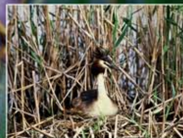
Serreta Somormujo lavanco Podiceps cristatus