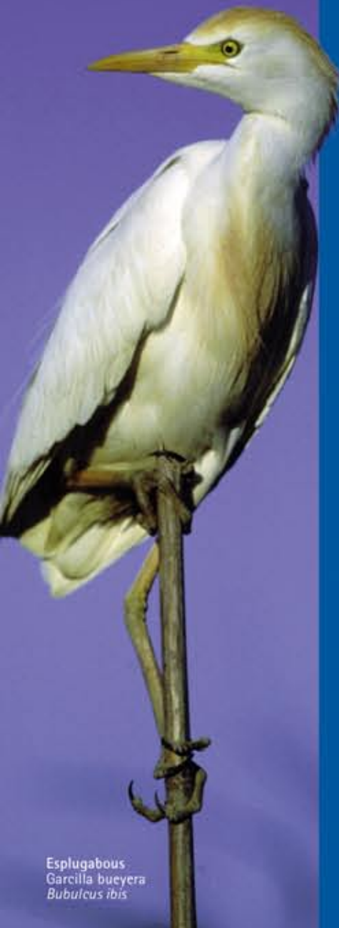
Esplugabous Garcilla bueyera Bubulcus ibis